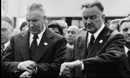
Edward Gierka i Piotr Jaroszewicz

Jest to określenie , nadane fali strajków obywateli polskich wywołanych znacznymi podwyżkami cen produktów. Punktem zapalnym zamieszek było przemówienie premiera Piotra Jaroszewicza , oraz ogłoszenie podwyżek 24 czerwca, przez rząd Edwarda Gierka . 25 czerwca strajk rozpoczęło 97 zakładów. Przez następne pięć dni zamieszki rozprzestrzeniły się po całym kraju.