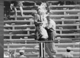
▲ Ryszard Siwiec (weteran AK, filozof) 8.09.1968 dokonał w Warszawie samospalenia podczas uroczystości Dziesięciolecia stając się symbolem polskiej drogi do niepodległości. Był to protest przeciwko udziałowi Ludowego Wojska Polskiego w inwazji na Czechosłowację.