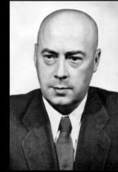
Premier Józef Cyrankiewicz

- "Każdy prowokator czy szaleniec, który odważy się podnieść rękę na władzę ludową, niech będzie pewniem że mu tę rękę władza ludowa odrąbie"