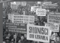
◀ Antyżydowskie hasła podczas kampanii propagandowych organizowanych przez zwolenników Gomułki, oskarżających Żydów o rozpętanie protestów studenckich.