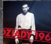
Plakat do współczesnej inscenizacji "Dziadów" w reżyserii Kazimierza Dejmka z udziałem Gustawa Holoubka