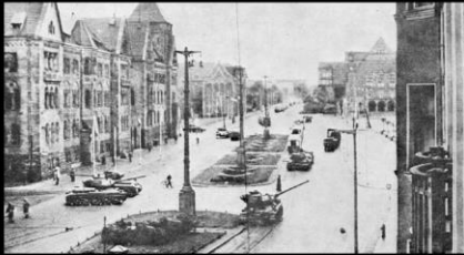
Czołgi na ulicach Poznania