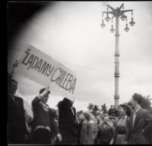
Demonstranci na ulicach Poznania