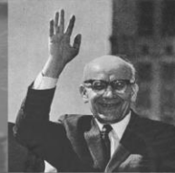
Władysław Gomułka (pierwszy sekretarz KC PZPR 1956-1970), podczas przemówienia 19.03.1968 atakującego "syjonistów"

◀ 8.03.1968 wiec studentów UW na ulicach Warszawy